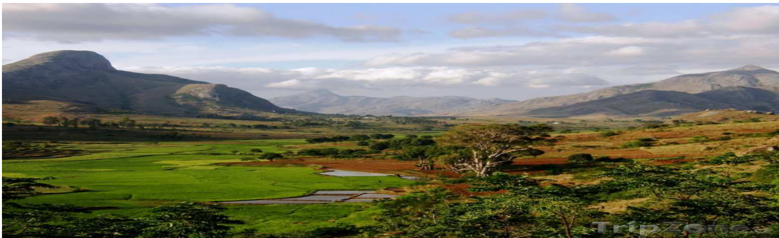
obr.5 Příroda na Madagaskaru

Tento projekt je spolufinancován Evropským sociálním fondem a státním rozpočtem České republiky