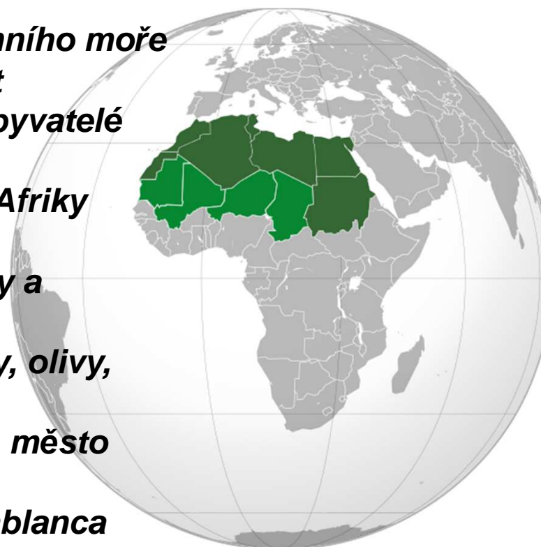
obr.2 Severní arabská Afrika