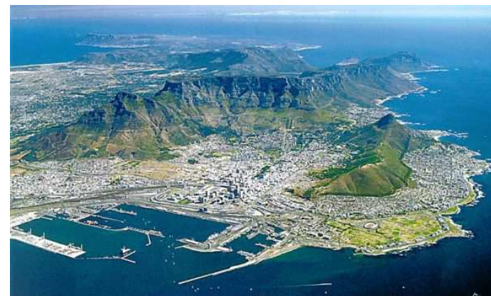
obr.6,7 Kapské město a Johannesburg