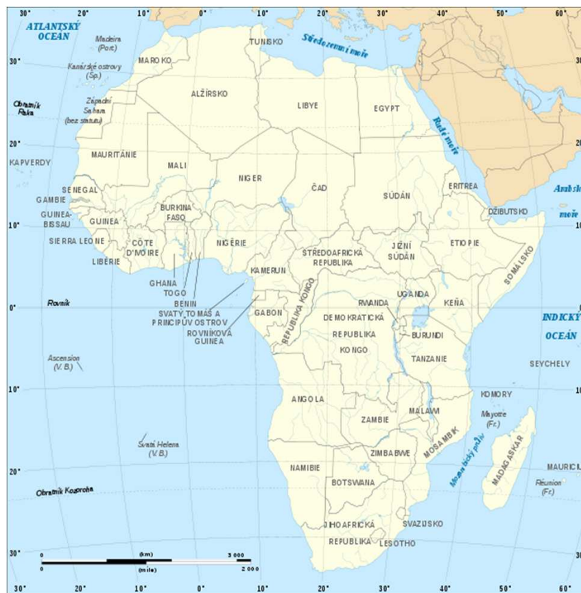
obr.1 Politická mapa Afriky