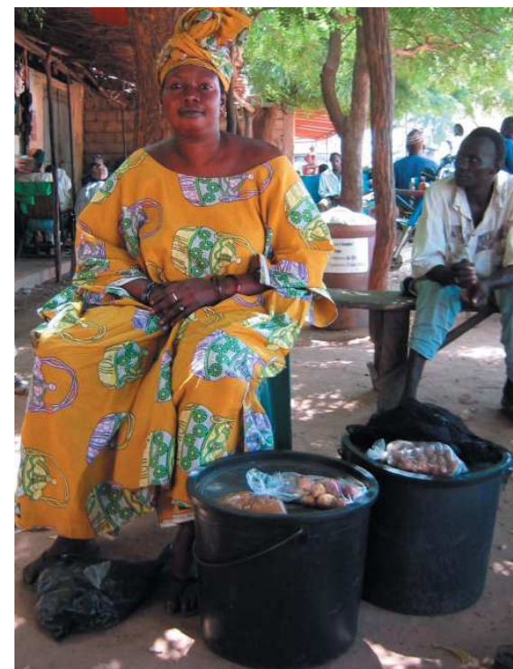
obr.3 Obyvatelka Senegalu