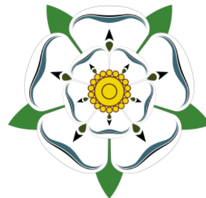
Znaky dvou anglických královských rofů – Yorků (bílá růže) a Lancasterů (červená růže)