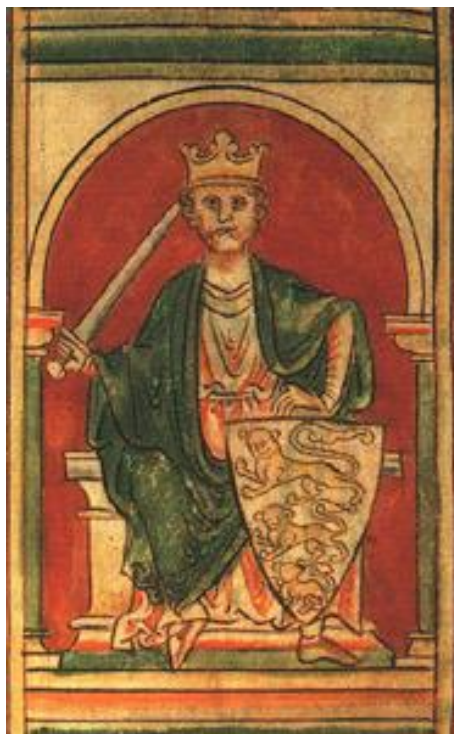
Středověké vyobrazení anglického krále Richarda Lvího Srdce