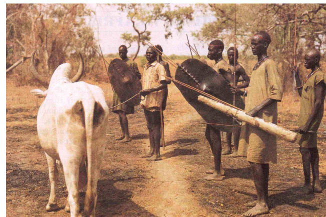
obr.2 Bojovníci kmene Dinka – jižní Súdán