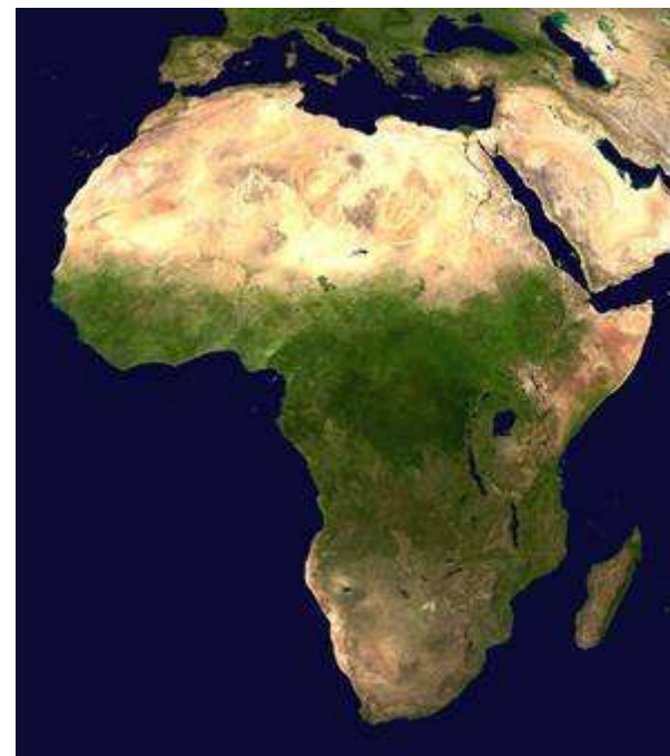
obr.2 Satelitní snímek Afriky