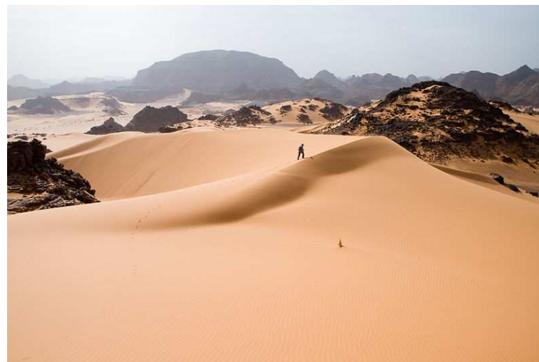
obr.3 Poušť v západní Libyi - Sahara