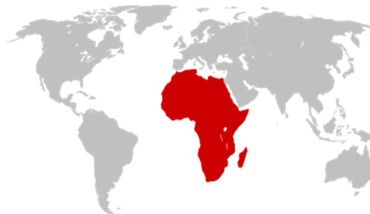
obr.1 Poloha afrického kontinentu na Zemi.