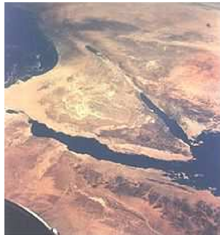
obr.3 Severní část Velké příkopové propadliny. Sinajský poloostrov (uprostřed) a Mrtvé moře a řeka Jordán (nad ním)