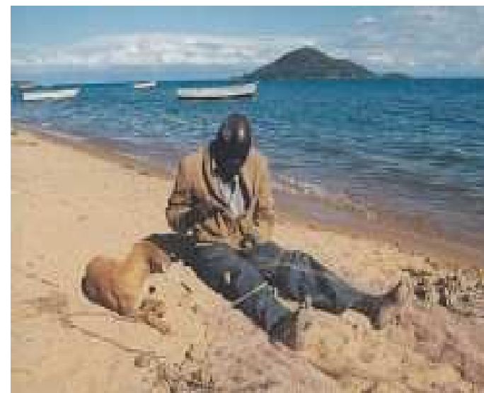
obr.4 Viktoriino jezero