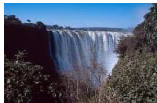
obr.3 Viktoriiný vodopád na řece Zambezi