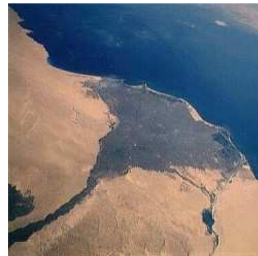
obr.2 Ústí Nilu do Středozemního moře